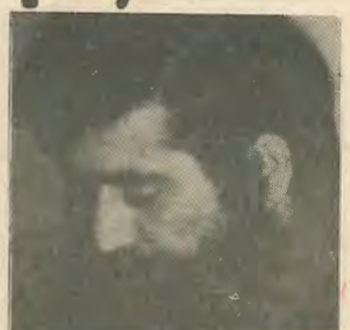
Είμαι πάνω από σώματα, πάνω από διαδικασίες, πάνω απ' όλα

Οι πρόσφατες επιθέσεις της κομματικής γραφειοκρατίας ενάντια σε αριστερα στελέχη της Ε.Δ.Ε.Κ. έχουν φτάσει το επίπεδο του παραλογισμού.